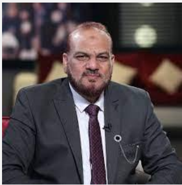
الإعلامي مصطفى الأزهرى