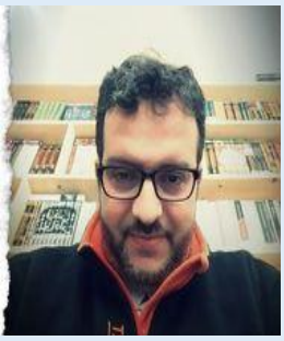
جريدة اعرف دينك

هل يجب أن نُذَكِّر بأن التدخين لا يعني العصمة! ولا يعني أيضا الانسلاخ عن طبائع البشر بما فيها من شهوات و غرائز وأشواق! بعض الشباب والبنات المتدينين يثيرون الشفقة بتصورهم "الملائكي" للتدين والمتدينين! والحق يقال أن بعض أصحاب الوعظ البارد المنتشرين في الشاشات والفيديوهات يمارسون هذا التلبس والتزييف، فهم فعلا يصورون التدخين كأنه "مصباح علاء الدين" حيث تتحول حياتهم إلى زهور وياسمين، وسكينة وملائكية رفيقة! أنت بشر قبل أن تكون متدينا/متدينة، وفيك جميع غرائز النفس وأهواؤها، وشهواتها، وأوهامها.. فتذكر هذا جيدا! نور الدين قوطيط-المغرب