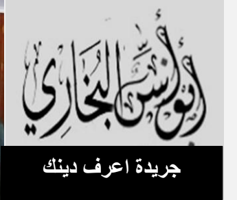
جريدة اعرف دينك

السلام عليكم ورحمة الله اعرف امرأة مطلقة تطلقت منذ أشهر قليلة والآن هي مخطوبة وقد تكون تزوجت منذ أيام..ولكنها لم تلتزم بالعدة بعد الطلاق ولا يوجد لديها أطفال..فما هي كفارة الزواج بدون عدة بعد الطلاق؟ الجواب وعليكم السلام ورحمة الله وبركاته. الحمد لله والصلاة والسلام على رسول الله ﷺ وبعد... لا يجوز للمطلقة أن تتزوج حتى تكمل عدتها وتنتهي ، ولو كان الزوج . وإذا تزوجها شخص أثناء العدة فالزواج باطل باتفاق العلماء، والاستمرار فيه يعتبر زناً إن علما بعدم انقضاء العدة، وتحريم النكاح فيها، وما أنجباه من أولاد فهم أبناء زناً. وبناء على ذلك، فإذا ثبت ثبوتاً شرعياً أن هذه المرأة قد تزوجت بذلك الرجل قبل انقضاء عدتها من فيجب التفريق بينهما على كل حال، وإن كانا جاهلين فلا إثم عليهما . والله تعالى أعلم.